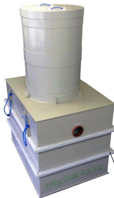
Жироуловитель ОТБ 5 с надставкой 1,3м с крышкой